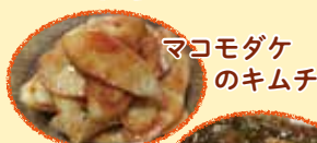
マコモダケ のキムチ